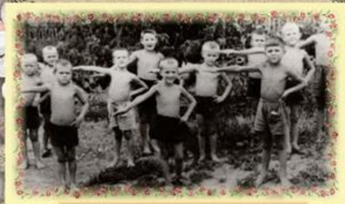
Утренняя зарядка, 1955 год