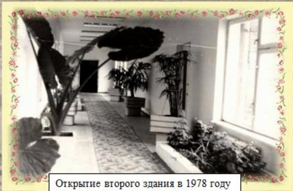
Открытие второго здания в 1978 году